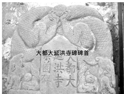
大都大延洪寺碑碑首

中部、办事处辖境西南隅。……其中，顾册不晚于辽或金。顾册本为固栅，因村周围设有固栅栏而得名，后取姓顾，又讹栅为册。” ①⑨