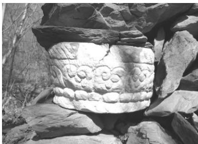
汉白玉如意连珠纹石构件

该寺院坐北朝南，规模宏大，遗址南北长 50 米，东西长 71 米。遗址上今存石刻文物主要有：汉白玉柱础石长 39 厘米，宽 38 厘米，厚 11 厘米；勾纹砖长 32 厘米，宽 15.5 厘米，厚 7.5 厘米；青石柱础长 40 厘米，宽 40 厘米，厚 5 厘米，其中，中心圆直径 27.5 厘米，厚 3 厘米，其形制与金陵主陵区出土柱础石相同；莲瓣形柱础石残存一半，下部为八棱形须弥座，上部为仰莲花瓣，高 30 厘米，上宽 34 厘米，下宽 30 厘米；八棱形四瓣柱础，下部为八棱形，直径 40 厘米，厚 7 厘米，每棱宽 15 厘米，上部四花瓣长 31 厘米，厚 3.5 厘米；汉白玉如意连珠纹石构件，圆形，