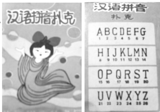
汉语拼音扑克封面和封底

功夫不负 复试验、修改， 克方案，已经 拿着完整的 扑克，找到教 同志。他们给 3月批给了专 出版发行了， 纷纷购买这