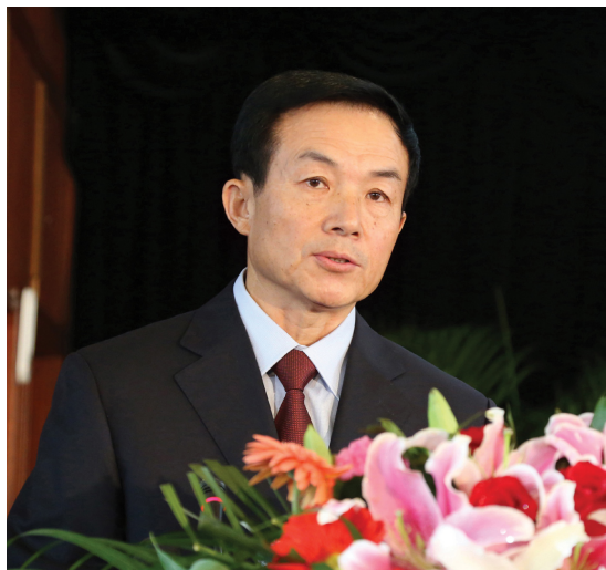
副主席任振秋作七届区政协提案工作报告

城镇化建设，提升城市管理和服务水平；增进全区人民福祉，保障和改善民生等方面提出意见建议。