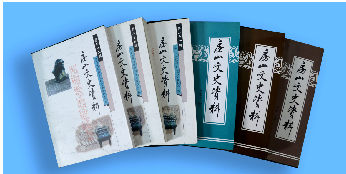
区政协编印的文史资料

《房山文史资料》第十九辑：设 5 个栏目并配“1986 年 4 月国务院副总理田纪云视察云居寺”、“1950 年 6 月良乡二区工作人员合影”、“1955 年春中共良乡县委、县政府部分领导在昊天塔前合影”、“房山晋商隆福局粮仓一角”、“石花洞一角”等 15 幅照片图片。经济史话栏目收录了《解放前及解放初期房良两县的农业》《房山三项农业气象科技成果的研究》《龙骨山下“红旗渠”》《三八干渠与房涞涿灌区》《开山填渠建东炼》《表盘厂的创业历程》《房山印刷厂的初期发展》《房山山区的荆编》《房