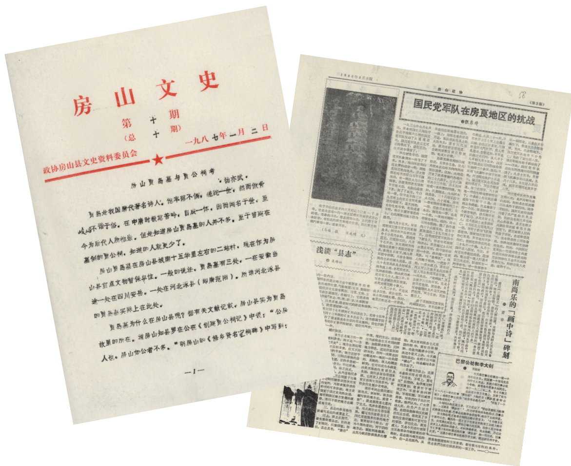
县政协编印的文史资料

《房山政协》文史掇拾栏目重登了“新中国成立前房山革命政权建制沿革”和“七十二座庵”考证等文章。