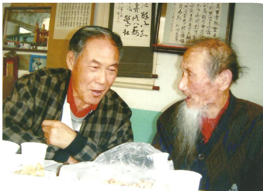
图八 于老在给笔者讲书法理论