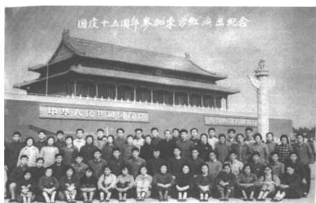
图2 北京矿业学院参加演出《东方红》的全体人员合影

10月2日晚上，《东方红》正式在人民大会堂进行首演，刘少奇、周恩来、朱德、邓小平、董必武等党和国家领导人与应邀来我国参加国庆庆祝活动的各国贵宾一起观看了演出。《东方红》是一部高昂激越的中国革命的颂歌。全剧共分《东方的曙光》、《星火燎原》、《万水千山》、《抗日的烽火》、《埋葬蒋家王朝》、《中国人民站起来了》、《祖国在前进》、《世界在前进》等八场。它以史诗般的宏伟风格和波澜壮阔的音乐舞蹈场面，生动形象地概括和展现了从中国共产党诞生到中华人民共和国成立，并开始进行社会主义建设的伟大历程，表现了英勇顽强的中国人民在中国共产党领导和毛泽东思想的指引下艰苦奋斗、前赴后继、决心战胜一切困难，建设一个强大的社会主义国家的坚强意志。