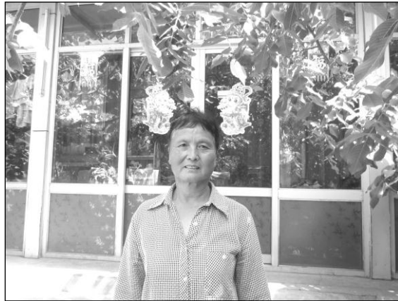
当年的“大芝子”今年已63岁

顺没文化， 人代写的。 人现在已经 丽莎”的村 名叫于凤 亲已经去 外参军，幼 不满8岁。 叫于凤文， 芝子”，至今