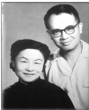
当年的杨绛与钱钟书夫妇合影

杨绛，1911年7月17日生于无锡，中国著名的作家、学者。著作有剧本《假如》、《风絮》；小说《倒影于小说》、《春泥集》；散文译作有《1939年以来的英国散文选》、《堂吉珂在杨绛笔下却变得有巨大又意味深远。