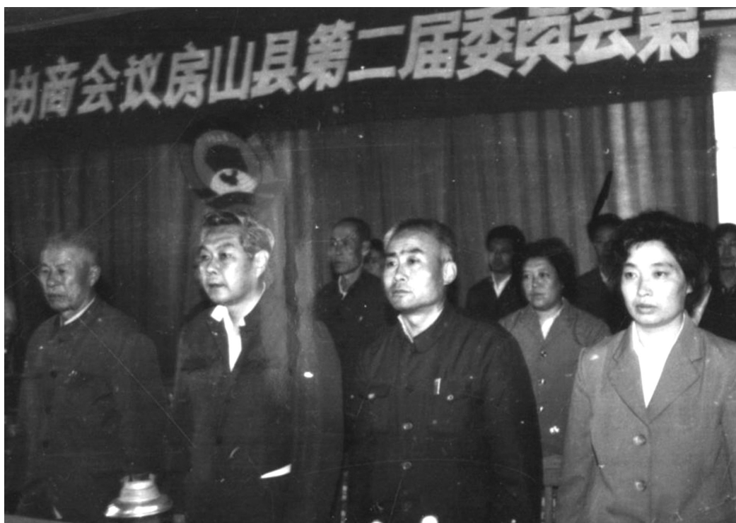
政协北京市房山区第二届委员会第一次会议