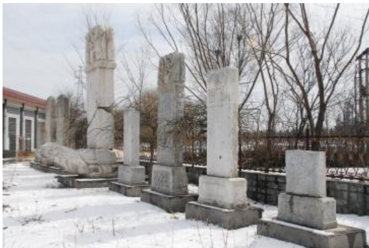
右二 吴佩孚撰文西山李公墓表

吴运乾（吴佩孚之孙）这样评价：先祖父的晚年生活绝不同于其他失败下野的军阀政客。他念念不忘的仍是“治国、安邦、平天下”，认为自己对国家和民族的兴衰负有责任，尤其不能容忍外族的侵辱。他一生自诩为关羽、岳飞和戚继光，当时社会上有“关岳吴”的赞许，我家的大门洞还悬有谢觉哉书写的大幅金匾“元敬再生”。以先祖父这样的为人和心志，后来却身陷日寇侵占下的北平，其心境和遭遇就可想而知了。